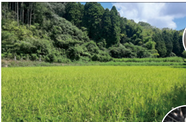
無農薬での米づくり。水田環境は絶滅が危惧されるトウキョウサンショウウオやトノサマガエル、ゲンゴロウなどの保全にも繋がる