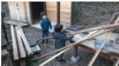
作業小屋や足場も自分たちで作る。貴重な自然体験の教育の場に