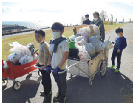
ごみ拾いを通じた環境教育